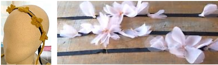
おみなえしのヘアバンド さくらの花のヘアバンド 作りたいお花にあわせて作り方がわかります。