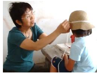
一人ひとりのサイズにあわせて