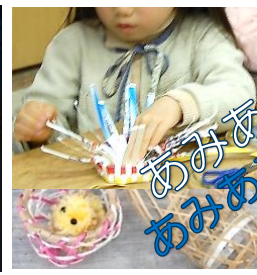
ヒヨコのお人形さんのかご