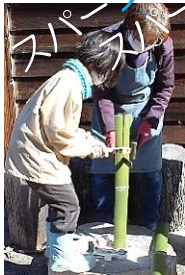
竹を切ったり、わったり、へいだり