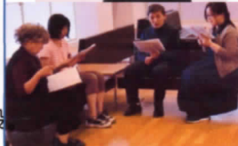
ナレーター指導もていねいにしてくださいました。