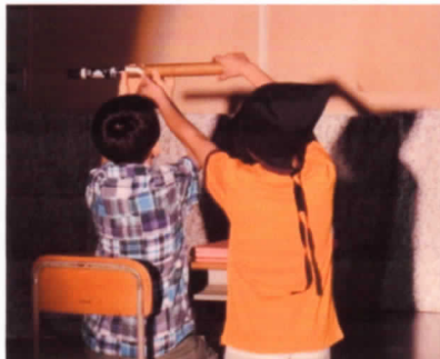
スルスルッとのびる木ペンを操作する黒子役。