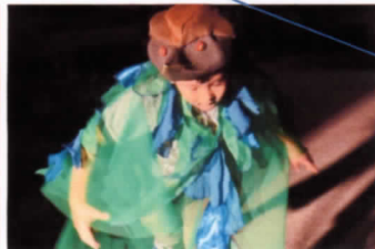
タイミングよく楽しい鳥の役